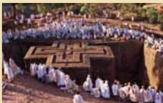
Lalibela, la chrétienne